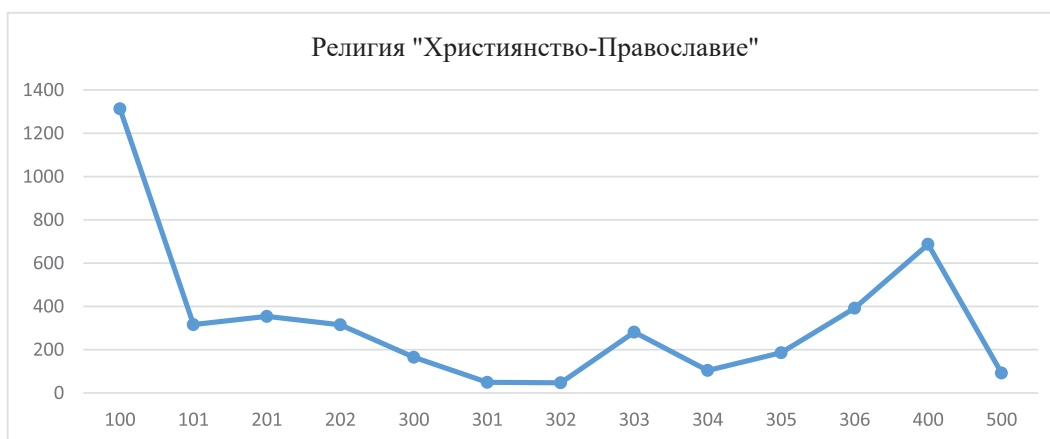
Фиг. 2. Честотно разпределение на концептуалните единици в учебника за трети клас по религия (християнство-православие)

Получените резултати от контент-анализа на двата учебника за трети клас „Религия (ислям)“ и „Религия (християнство-православие)“ показваха наличие на всички търсени категории, отразяващи социалната роля на религията. Очаквано, предвид конфесионалния характер на учебния предмет, най-висок е дялът на категорията „сакрално-мистична функция“ в подкатегиите с код 100 (теологични) и код 101 (свързани с култа). В учебника „Религия (ислям)“ те имат съответно стойности 721 и 912 брой думи, описващи категорията. За „Религия (християнство-православие)“ са съответно 1313 и 316 брой думи.