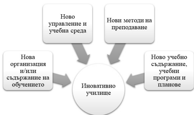
Фигура №1: Модел на иновативно училище в Р България

Иновацията в училище или педагогическата иновация се определя като краен резултат от иновационната дейност, получила реализация във вид на нов образователен продукт или усъвършенстван процес, използван в практическата дейност (Наредба № 9 от 19.08.2016 г. за институциите в системата на ПУО, чл. 70, ал. 3). Творчески работещите училища