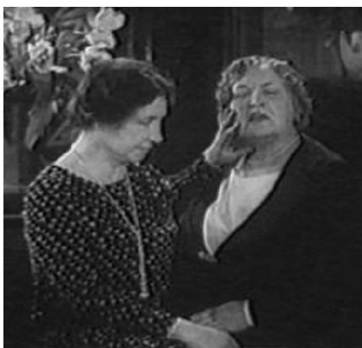
Хелън Келър и Ан Съливан общуват чрез метода „ТАДОМА“ ( https://www.afb.org/serve/media/52351 )

Въпреки успехите Съливан твърди, че методът „Тадома“ е бавен и не винаги разбираем.