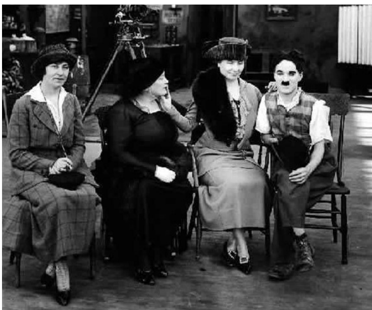
Поли Томпсън, Ан Съливан, Хелън Келър и Чарли Чаплин – Холивуд, 1918

През 1927 г. започва ново влошаване на зрението на Ан Съливан, а през 1929 г. лекарите енуклеират дясното ѝ око. Учителката губи способността да чете и все повече използва слухови ориентири. За да е сигурна, че Поли Томпсън пълноценно ще използва начина на общуване с Келър, тя провежда с нея индивидуални занятия. През 1928 г. Съливан категорично отказва на Хелън Келър да предостави данни за написването на биография. С пословичната си скромност първоначално отхвърля предложението на университета „Темпъл“ в Бостън за присъждането на званието „Доктор Хонорис Кауза“. В крайна сметка това се случва през 1931 г. През 1932 г. Съливан има намерение да обучава едно сляпоглухо бебе, но съзнавайки влошеното си здраве, се отказва. Година по-късно заедно с Келър и Томпсън тя посещава своята прародина – вечнозелената Ирландия. Ан е смутена от обстоятелството, че се придвижва с луксозна кола на фона на голямата бедност.