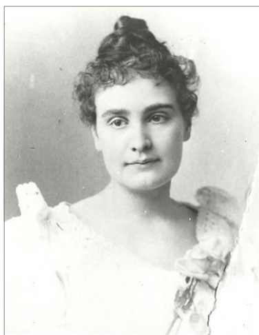
Ан Съливан, 1894 г.

Великата педагогическа мисия на 21-годишната Ан Съливан започва на 03.03.1887 г., когато тя се отправя на юг към Тоскумбия (Алабама), за да започне обучението на Хелън Келър. Дългото пътуване, неизвестността и предстоящите огромни трудности разстройват младата девойка. Проявената човешка загриженост от кондуктора на влака предразполага Ан да разкаже за живота си и за целта на пътуването. Служителят я успокоява с твърдението, че южняците ще ѝ харесат, защото са добри хора. Само за няколко седмици Съливан постига истинско чудо в обучението на Келър.