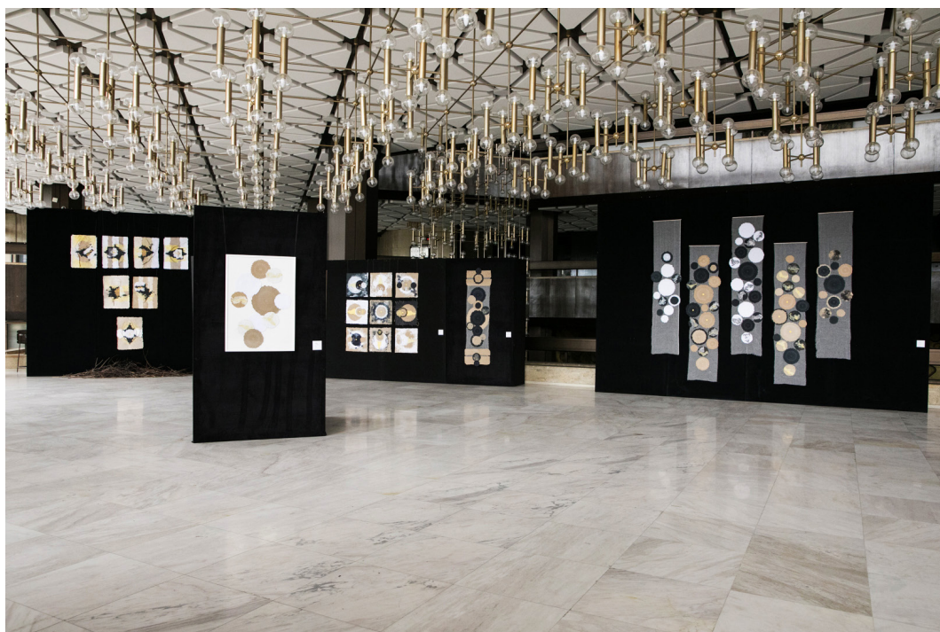
4. Общ изглед от изложбата