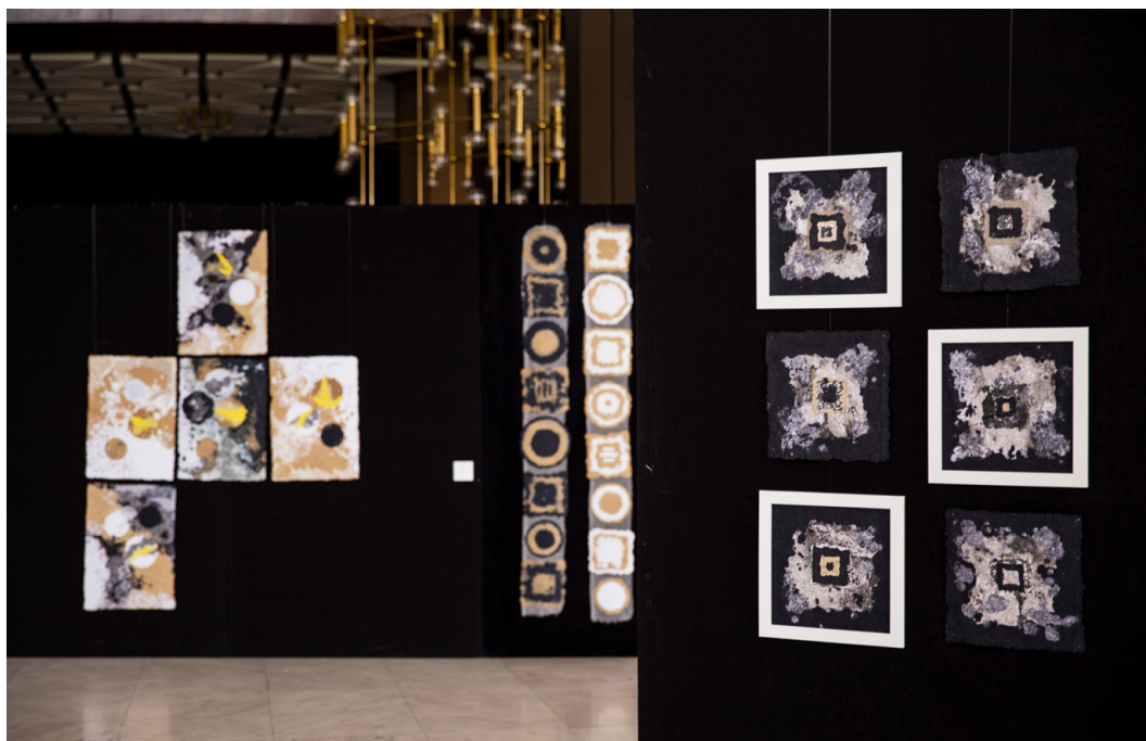
7. Фрагменти от сериите „Контролиран хаос“ (вляво), „Разказ за Сътворението“ (в средата) и „Парчета Сътворение“ (вдясно)

Екологичните аспекти на рециклираната хартия са важен момент в концепцията на произведенията. Но ръчната хартия е препратка и към древните техники за производство на може би най-универсалната медия, върху която човечеството записва своите знания. В този смисъл „хартията е не просто функция на цивилизацията – тя означава цивилизация“ 3 . Семантичната страна на ръчната хартия е свързана с идейно-философските послания на произведенията, в които основната тема е проблемът за връзката със земята, с природата, с древните традиции и културните корени.