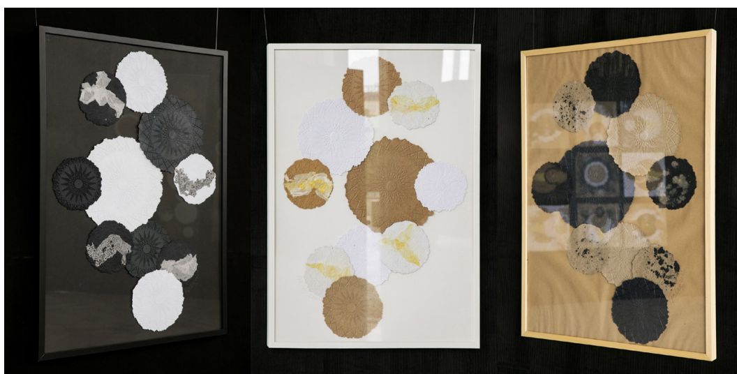
9. „Баланс I, II, III – всяка работа: 100/170 см