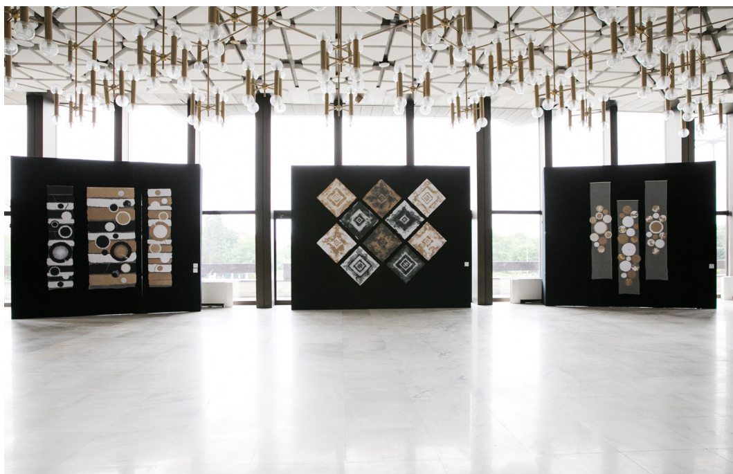
6. Инсталациите „Пътеки“ 300/200 см (вляво), „Парчета Сътворение“ 250/400 см (в средата), „Допълване II“ 250/150 см (вдясно)

Експозицията включва няколко серии произведения, които варират от малкоформатни работи с размери 35/35 см до голямоформатни инсталации до 250/400 см. Основен творчески подход е модулният принцип. Отделните части на работите са изградени от повтарящи се фрагменти и могат да бъдат препореджани по различен начин в зависимост от спецификите на изложбеното пространство. Най-често използваният мотив в модулите е слънцето като препратка към древните символни системи, в които соларното играе ключова роля. Други често използвани орнаменти са квадратите и ромбовете. Те са свързани с идеята за земното начало и човешкия свят, като същевременно създават и асоциации за устойчивост и цялостност. Използвани са също флорални мотиви и абстрактни форми, които често покриват цялата повърхност на парчетата ръчна хартия. Някои от елементите са направени, като хартиената каша е отлята върху релефни орнаментални повърхности или чрез отпечатване на различни предмети във все още мокрия хартиен пласт. Други са изработени чрез възграждане на структури и материали в отлятата хартия, а трети – чрез директно натрупване на различна по цвят хартиена маса, с която „се рисува“ желаната форма.