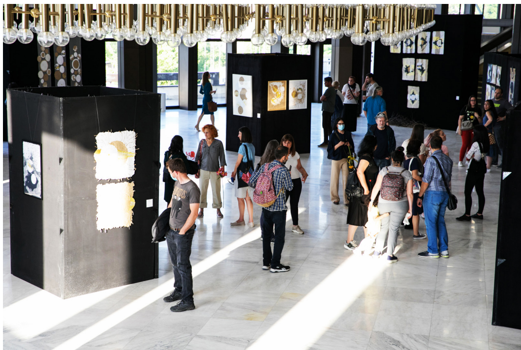
3. Момент от откриването на изложбата

Изложбата „ОРНАМЕНТИ“ е своеобразно обобщение на моите творчески търсения до този момент, които се развиват основно в две посоки. Едната е свързана с проучванията ми върху орнамента и неговата символна функция, а втората – с интереса ми към ръчно рециклираната хартия, която е не просто медията, върху която е изградено произведението, а е важен пластичен елемент.