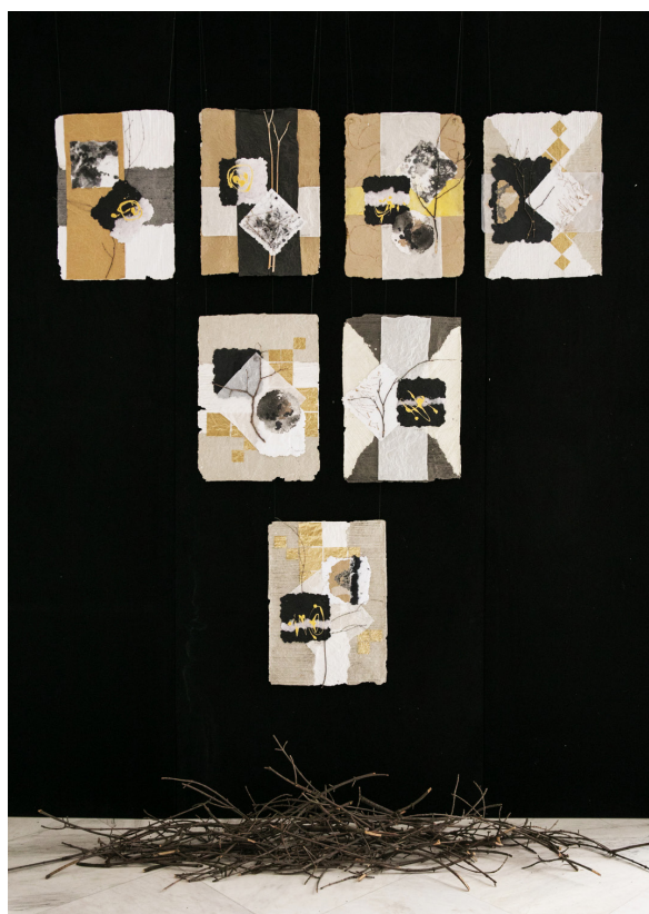
5. „Родословно дърво I“ – инсталация, 300/250 см.