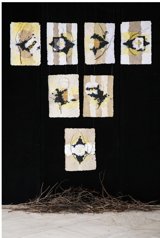
8. „Родословно дърво II“ – инсталация, 300/250 см