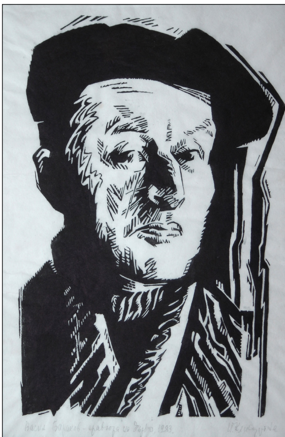
Петрана Клисурова, „Портрет на Васил Барakov“. Дърворез, ХГ Смолян

Вера Динова-Русева разделя творчеството на Петрана Клисурова на три основни периода. Първият обхваща годините преди обучението в Академията; вторият е времето, когато учи в Академията и непосредствено след това (30-те и 40-те години) – време, когато тя работи предимно в областта на живописта и рисунката; третият период са годините от средата на 40-те до края на 60-те. Изследователката на творчеството на художничката специално подчертава усилването на тенденциите към декоративност в работите, създадени след 70-те години 37 .