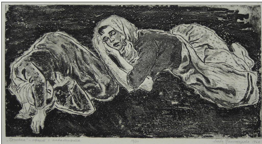
Люба Паликарова, „Почивка“. Офорт и акватинта, ХГ Смолян

В началото на своето творчество Паликарова работи предимно в областта на гървореза, а в средата на 40-те години на ХХ в. активно започва да работи и в областта на литографията и на графиката върху метал. Темите и сюжетите ѝ са „почерпани от ритъма на всекидневието“ 28 , тя предпочита спокойни битови сцени, статични физурални композиции, пейзажи от различни места из България; рибари, които разплитат мрежите си; селянки, които си почиват на полето; портрети, „наситени с много любов и преживяна автентичност“ 29 . В творбите ѝ Несторов вижда опит за изобразяване на изживяното, а не на видяното. Паликарова „проявява и свое лично виждане и отношение към човешката фигура и природата“ 30 и въпреки западното влияние, успява да изгради личен авторски почерк. Като основно качество на художничката Евтим Томов определя добре култивирания вкус и „чувството за отмереност при съпоставката на черно и бяло“ 31 . Откроява и портретите, които прави, като отбелязва, че в тях тя „постига прилика и характер“ 32 . Тук трябва да отбележим, че всъщност портретът не е жанр, който е широко разпространен в българската графика.