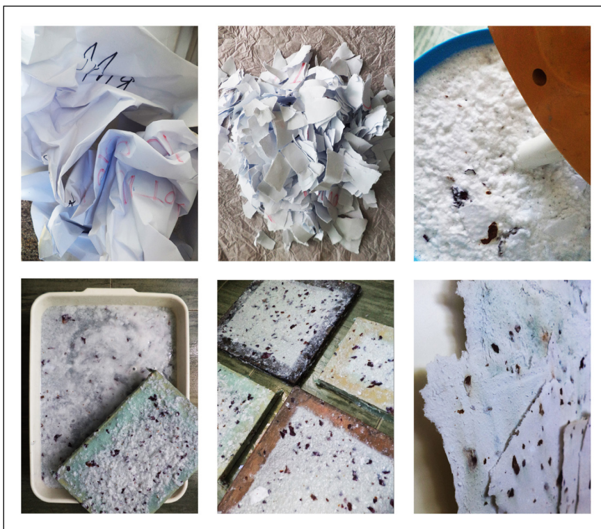
Фиг. 1. Етапи при изработване на ръчно рециклирана хартия

В зависимост от метода на отливане и съхнене ръчната хартия може да придобие определени качества – може да бъде по-гладка или по-релефна, по-ронлива и пореста или по-жилава и гъвкава, с по-наситен цвят или леко тонирана. След изсъхване върху ръчната хартия може да се рисува – с туш, гваш, акварелни, темперни, акрилни, текстилни бои. Тя може да бъде използвана в различни колажи, като художникът може да я манипулира по най-различни начини. Много често ръчната хартия е не толкова медия, която носи върху себе си произведението, колкото е самото произведение. Освен това тя може да бъде използвана като вграден елемент в различни двумерни и тримерни произведения.