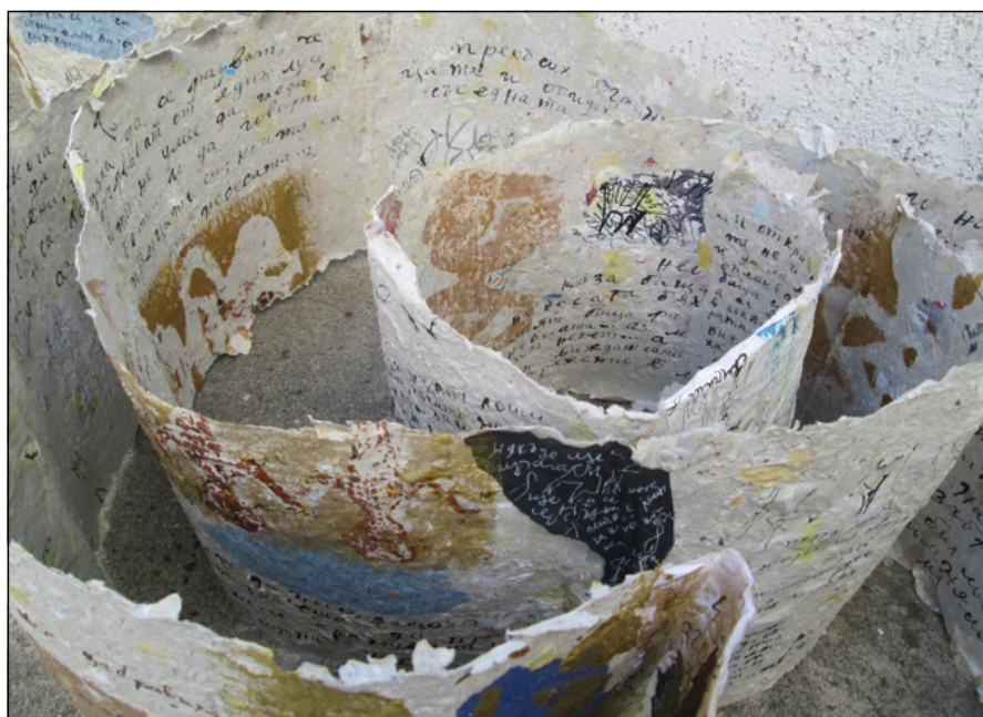
Фиг. 3. Лаура Димитрова, 2013 г. „Свитък“ I, рециклирана хартия, колаж; вариращи размери