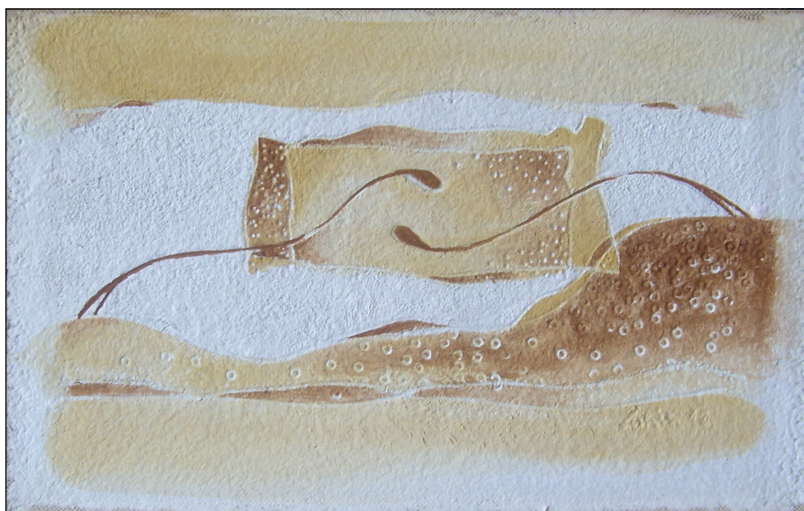
Фиг. 5 Галина Георгиева Халачева, „Докосване“ I, Художествена галерия – Добрич, рециклирана хартия, 20x32 см