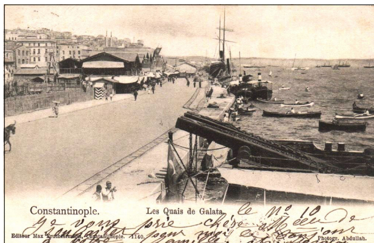
4. Кеят „Галата“ на Босфора в Истанбул – края на XIX век

Тази активност на Промео из Ориента е отразена презгледно в каталога на „Люмиер“ – сякаш за да улесни изследователите и разреши дилемата. Репортажите от Яфа са 7 (№ 394–№ 400), от Йерусалим – 8 (№ 401–№ 408), от Витлеем – 1 (№ 409), от Бејрут – 2 (№ 410–№ 411), от Дамаск – 2 (№ 412–№ 413). Останалите 4 (№ 414–№ 417) са от Константинопол 24 . Същото потвърждава и Бернар Шардер – основателят (през 1982) на института „Люмиер“ в Лион, който обаче подрежда заглавията в различни тематични раздели 25 . По-съществено е, че в първия източник са отбелязани датите на премиерните прожекции в Лион на два от филмите: 13/25 април 1897 за № 414 („Парад на турска пехота“) и 20 април/2 май 1897 за № 405! „Тезата 1897“ бива подкрепена както от две справки в „Енциклопедия на ранното кино“, уверяващи, че през същата година Промео снима в Египет 26 , така и от информацията в авторитетния сайт „The German Early Cinema Database“ (TGECDB), предлагащ данни за около 45 000 филма, показани в немските кина от 1895 до 1920, доказваща, че „Панорама на бреговете на Босфора“ (№ 417) е показан през октомври 1897 в Хамбург 27 (Германия) 28 .