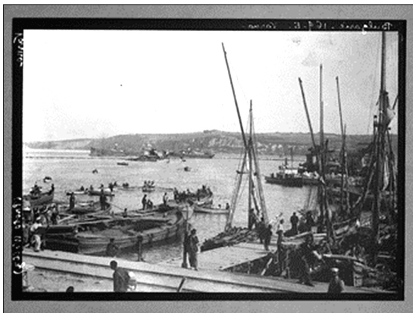
2. Варненското пристанище в края на XIX век

фирмите, продуциращи филми по това време: „Едисон“ 5 , „Люмиер“ 6 , „Стар филм“ на Жорж Мелиес (1861–1938) 7 , „Патé фрер“ 8 ... Кой е бил тайнственият кинооператор, въртял манивелата на своята камера през лятото или ранната есен на 1896 във Варна? Кой е бил създателят на първия филм, реализиран на Балканите? Едва ли споменатият Мелинсон, макар софийската преса да го представя като „професор по физика“.