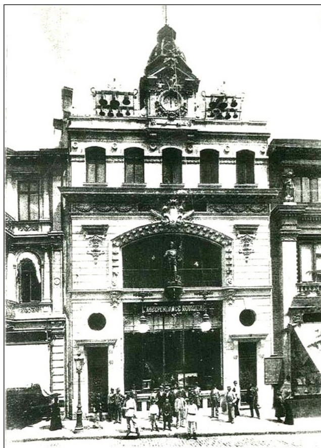
3. Сградата на в. „Независима Румъния“ – там на 27 май 1896 г. се е състояла първата кинопроекция в Букурещ

Два дни след белградските сеанси и Букурещ бива озарен (на 27 май) от лъчите на кинопроекторна машина. Инсталирана е в балната зала на внушителната сграда на в. „Независима Румъния“ от гастролиращите специални пратеници на братя Люмиер: Луи Жанен (Louis Janin), Шарл Делатр (Charles Delattre) и братята Бонер (Bonheur) 10 , които също (като Каре и Жирен) използват апаратура, произведена от „Люмиер“. Продукция на тази фирма са и показаните филми 11 – поредно указание, че гостите са били „демонстратори пропагандатори“ на „Братята“ (определението е на американския киноисторик Джей Лейга).